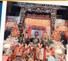
เทพเจ้ากวนอู วัดกวนไท