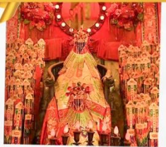
เจ้าแม่กวนอิมของอ่ำ

โรงแรม Eaton Hotel และ iclub Mong Kok Hotel